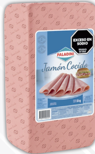
Jamón cocido PALADINI x 100 grs.