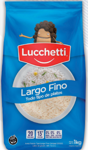
Arroz LUCCHETTI largo fino bolsa x 1 kg.