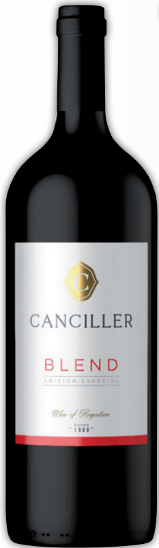
Vino CANCILLER tinto x 1125 cc.

• OFERTAS VÁLIDAS DEL 09/04 AL 21/04/26 O HASTA AGOTAR STOCK • CONSUMO FAMILIAR •