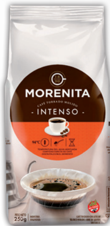
Café molido MORENITA intenso x 250 grs.