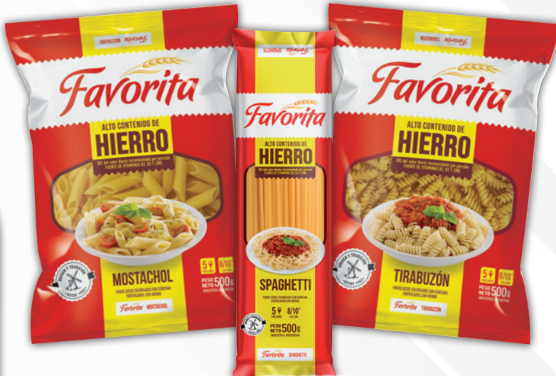
Fideos FAVORITA tirabuzón / mostachol / tallarín / spaghetti x 500 grs., c/u.